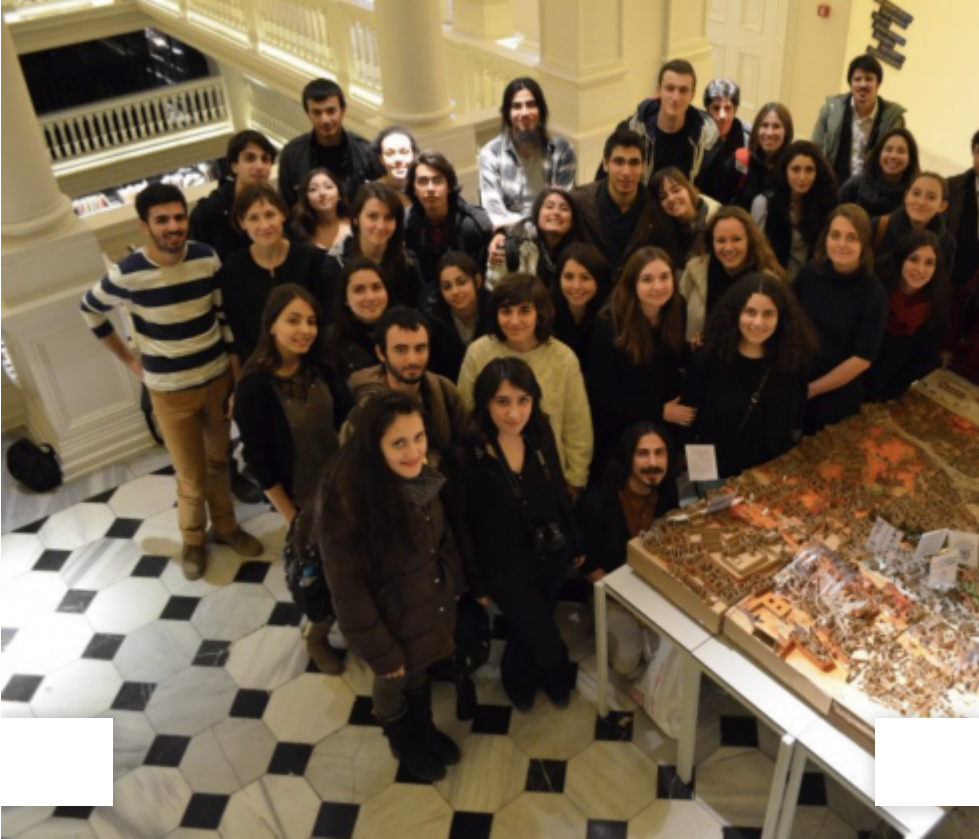
İTÜ Öteki Kafalar Stüdyosu, 2012; f

Stüdyo kültürünü besleyen bir diğer konu ise mekansal organizasyon. Yaratıcı endüstrinin desteğini tam da bunun için çağırıyor Woolsey. Design Museum, Somerset House gibi kurumların yanında Makerversity ve Blackhorse Workshop gibi yapma kültürüne olanak sunan çalışma mekanları programa destek veriyor. Başka yaratıcı alanlarda çalışanlarla da yan yana gelme imkanı tanıyan bu mekanlar, stüdyonun yaparak öğrenme geleneğine de cevap vermiş oluyor.