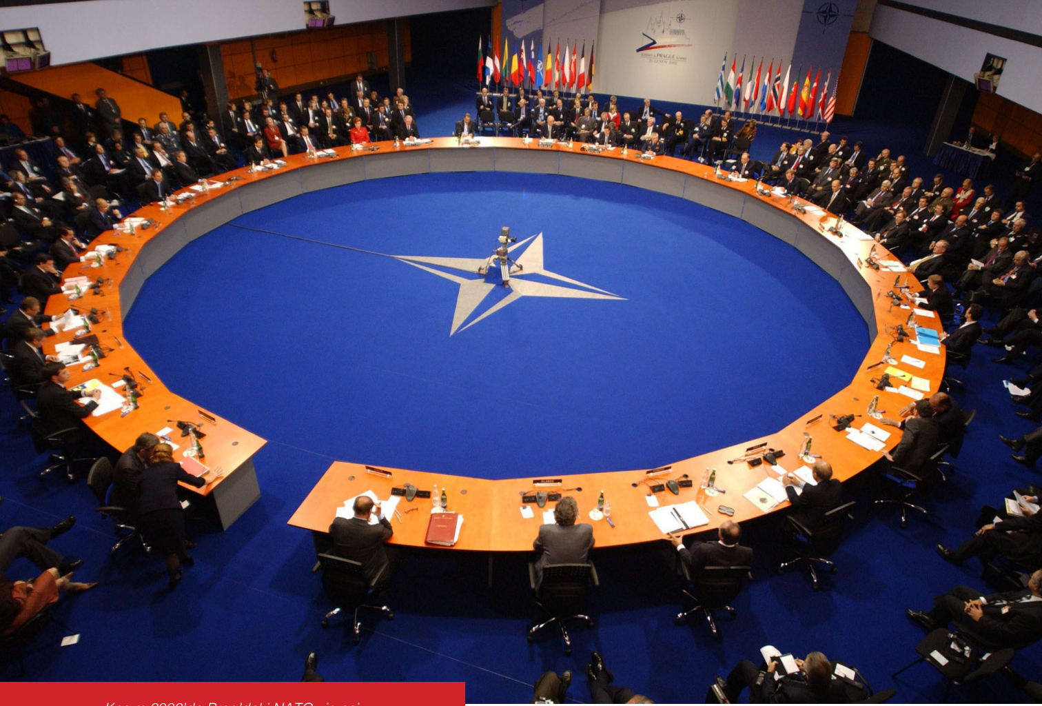
Kasım 2002'de Prag'daki NATO zirvesi

Türkiye, on yıllar boyunca, "Sovyet tehdidini üzerine çekerek Batı Avrupa üzerindeki baskıyı hafifletmek" olarak tanımlanabilecek NATO içindeki misyonunu fazlasıyla yerine getirmesinin karşılığında, müttefikleri tarafından, ancak kağıt üzerinde verilen garantiler ve İttifak'ın nükleer caydırıcılığı ile yetinmesi beklenmiştir.