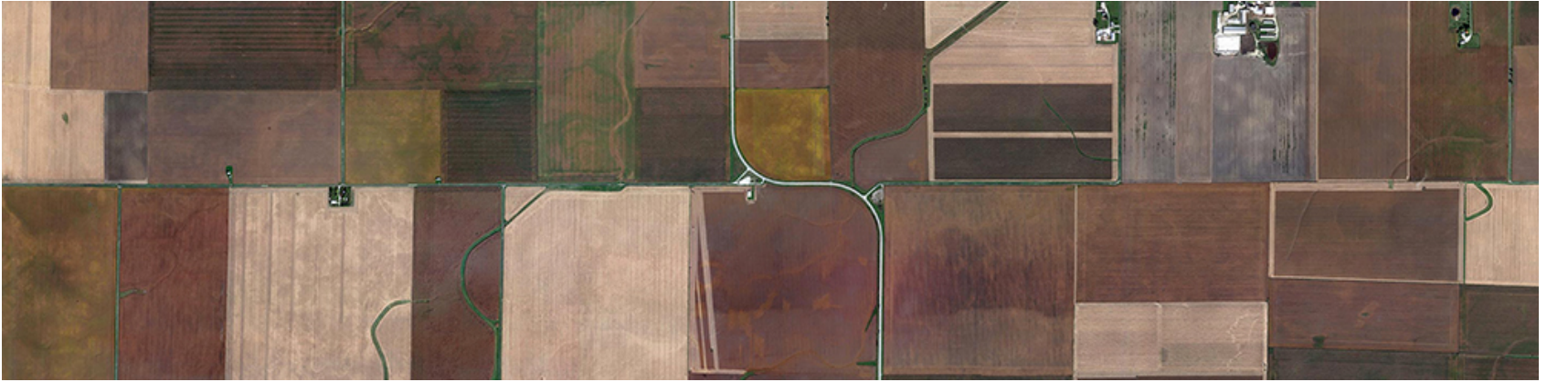
Harita verisi: Google, Landsat/Copernicus

Birleşik Devletler Ohio ve Mississippi nehirlerinin batısında kalan alanları, yani dev bir kıtayı, yerleşime açmak amacıyla 1785 tarihinde Land Ordinance adlı yasayı çıkardı. Henüz, 'beyaz adam' tarafından ayak basılmamış alanları da içeren bu bölgelerin istekli yerleşimcilere satılabilmesi amacıyla da paralel ve meridyenleri esas alan, dolayısı ile henüz görülmemiş, ölçülmemiş yerlerin bile tanımlanmasını sağlayan Public Land Survey System yöntemini kullanmaya başladı. Bu yöntem bir çeşit 'orda bir köy var uzakta, o köy bizim köyümüzdür, görmesek de gitmesek de' gibi, önceden tespit edilen referanslar yardımı ile bütün bir kıtanın parsellenmesini sağlayarak Birleşik Devletler coğrafyası ve peyzajı; kent ve kırsal yerleşim biçimi; bu biçimin oluşturduğu kültür ve davranış biçimlerini çok derinden etkiledi.