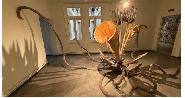
5. Elhamra Han