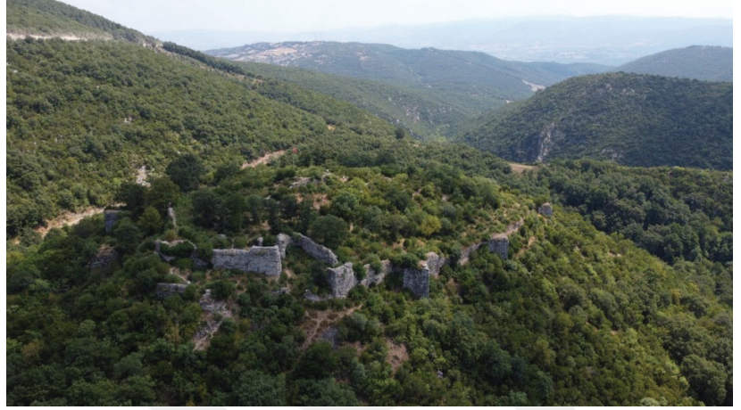
TEHDİT ALTINDAKİ KÜLTÜR MİRASI: Kaybolan Savunmanın İzinde: Balıkesir Kırsalındaki Bizans Kaleleri