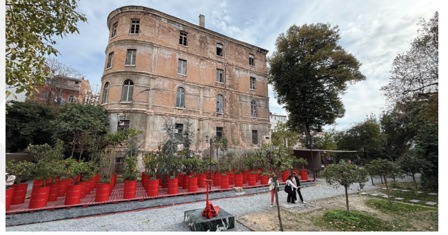
7. Eski Fransız Yetimhanesi Bahçesi