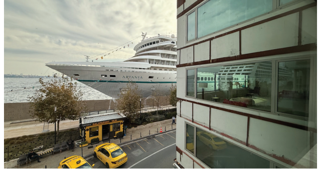
9. Zihni Han'dan Galataport'un görünürde "kamusal" olan kıyı şeridine bakış