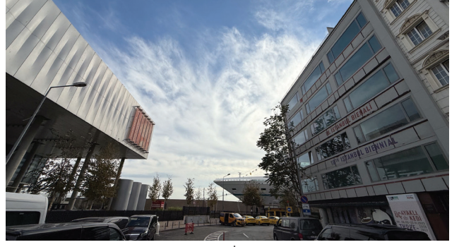
3. Zihni Han'ın girişinin Galata Port ve İstanbul Modern ile olan ilişkisi