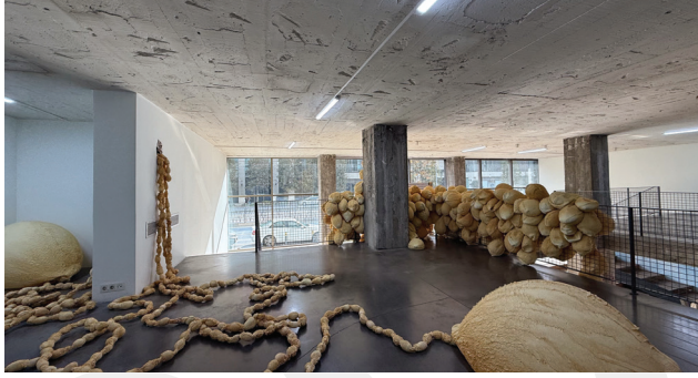
6. Eskiden Studio-X olarak kullanılan Meclis-i Mebusan 35