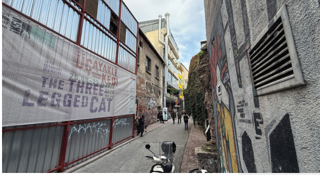
4. Kentsel dönüşüm altındaki Karaköy Murakıp Sokakta yer alan eski Kûlah Fabrikasının girişi