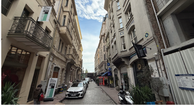
8. Galata Şarap İskelesi Sokak'ta yer alan Galeri 77 ve Muradiye Han'ın girişlerinin sokağın sonunda yer alan ve denizle ilişkiyi bloke eden The Peninsula Otel'in duvarıyla olan ilişkisi