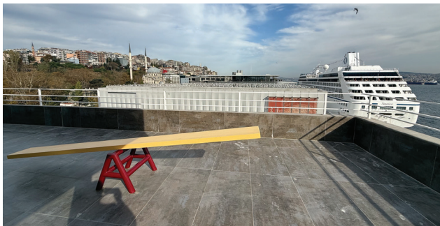
10. Galata Port, İstanbul Modern, Zihni Han ve "yaratıcı sınıf estetiği"

tayin etmeye çabalarlarken dinlenmenin gerekliliğini kav- rıyor; aynı zamanda korunmaya ve iyileştirilmeye ihti- yaç duyan yanlarımıza özen göstermeyi öğreniyoruz. 5