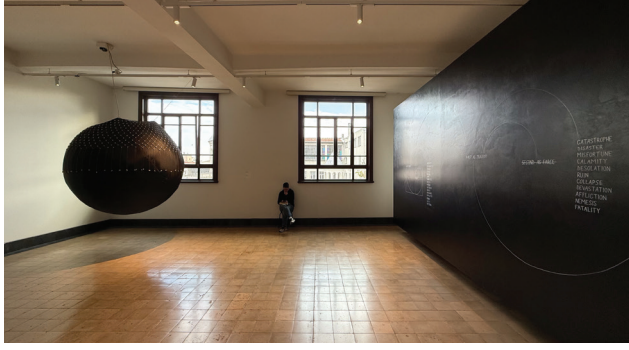
2. Galata Rum Okulu