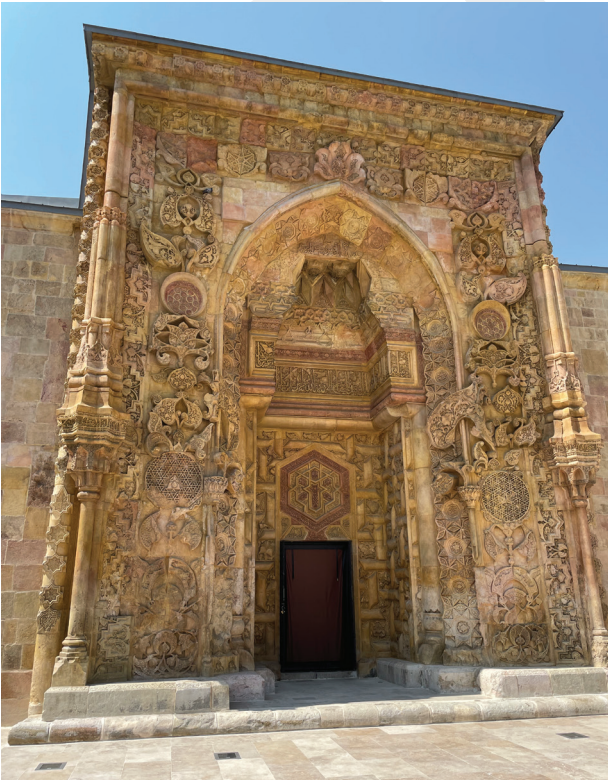
DOSYA: Türkiye'nin Kırk Yıllık Dünya Mirası Varlıkları