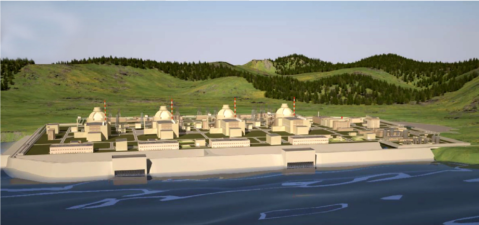
Akkuyu Nükleer Santral Projesi

Sorunların temelinde, ülkelerin nükleer güce sahip oldukları takdirde, bu alandaki imkan ve kabiliyetlerini hangi amaçlar peşinde kullanacakları sorusu yatmaktadır. Barışçıl amaçlar çerçevesinde kullanıldığı takdirde elektrik enerjisi üretmek, tıpta teşhis ve tedavide kullanmak, ve tarımda verimliliği