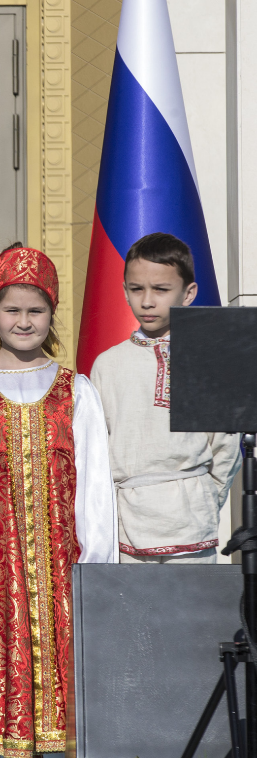
Akkuyu Nükleer Santrali'nin temeli Cumhurbaşkanı Erdoğan ve Rusya Lideri Putin'in katıldığı törenle atıldı

Rusya Devlet Başkanı Vladimir Putin, Cumhurbaşkanı Recep T. Erdoğan'ın resmi konuğu olarak 3 Nisan 2018 tarihinde Ankara'yı ziyaret etti. İki liderin ortak basın toplantısında, Putin Akkuyu'da temeli atılan nükleer güç santralının birinci ünitesinin işleme alınmasını Türkiye Cumhuriyeti'nin 100. Kuruluş yıldönümü olan 2023 yılına kadar yetiştireceklerini ifade etti. Bu açıklama ile, Türkiye ile Rusya Federasyonu arasında, arada bir kez tökezlese de, son on yılda artarak gelişen ilişkiler ağı içinde yüksek stratejik öneme sahip olan Akkuyu nükleer santralının kurulması konusunda yıllardır süren tartışmalar tekrardan gündemdeki yerini aldı. Akkuyu merkezli olarak yapılan tartışmaların bir kaç boyutu bulunmakta. Bunlardan bir tanesini, nükleer enerji konusunda dünyanın hemen her köşesinde yapılan "güvenli mi, tehlikeli mi, ucuz mu, pahalı mı" ekseninde, nükleere karşı olanlarla, nükleer enerjiji savunan kesimler arasındaki amansız tartışma oluşturmaktadır.